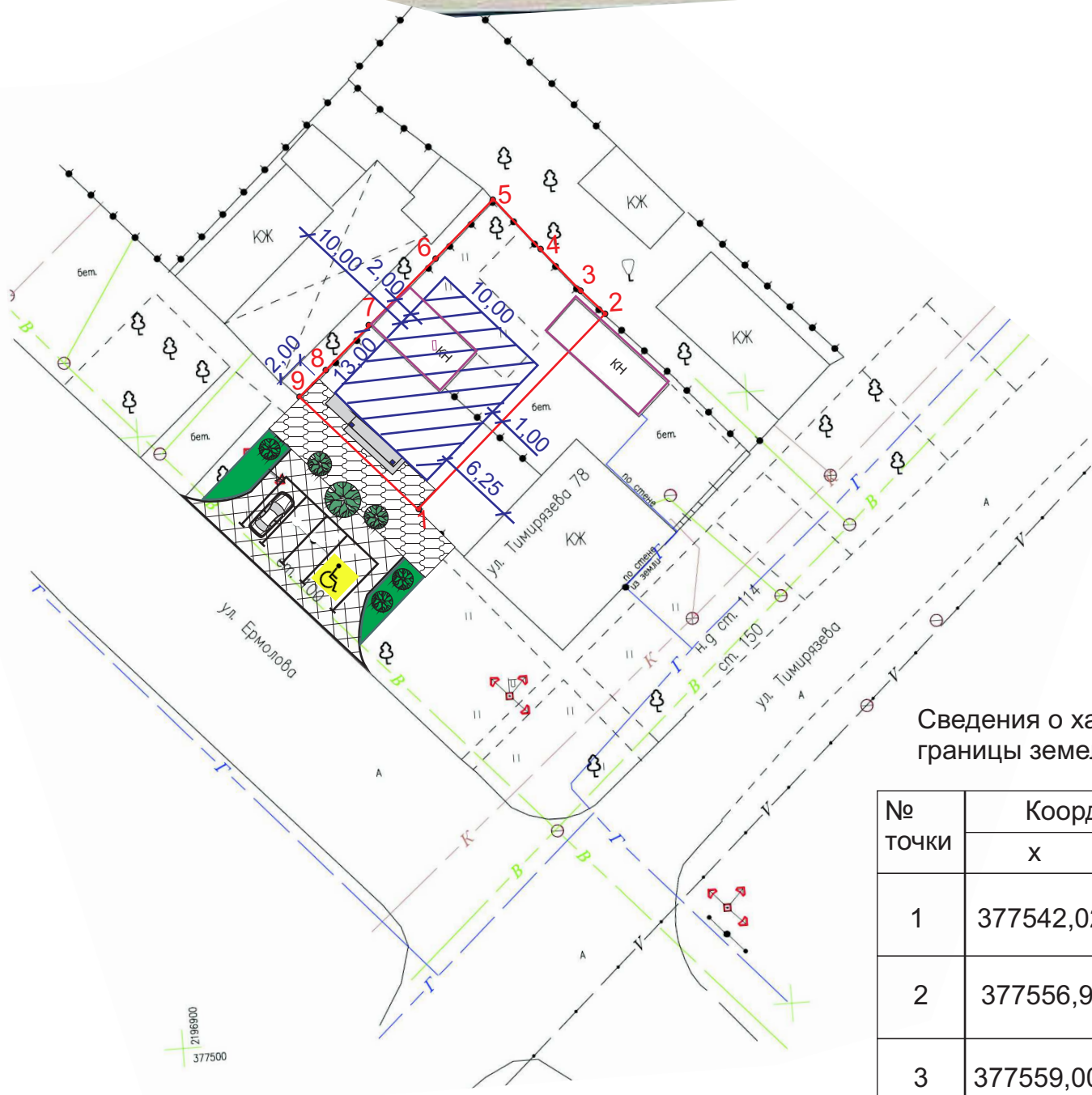
Сведения о характерных точках границы земельного участка