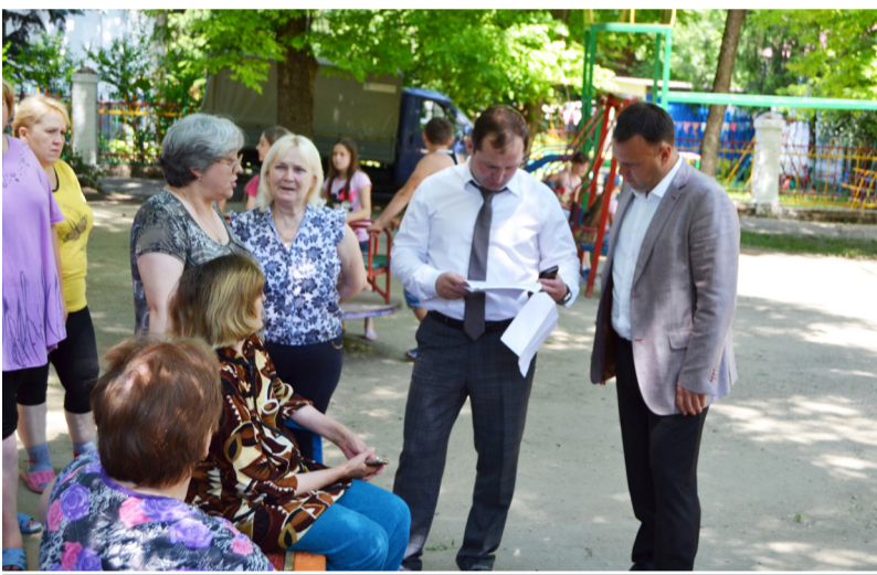
Встреча главы с жителями поселка Терского.

Мы не можем сразу сделать весь километраж, но методами интервальных впрысков в разумный срок приведем ее в нормативное состояние. И это в размерах даже консолидированного бюджета – очень даже глобальная задача. Это 25% наших возможностей.