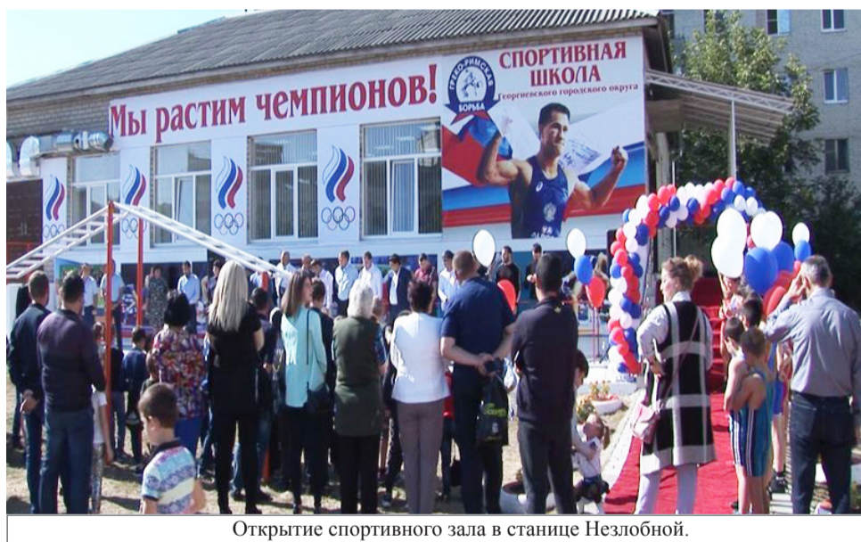
Открытие спортивного зала в станице Незлобной.

бюджету пяти-шести сёл. Скажем, бюджет Крутойярки в пору ее самостоятельности был порядка 9,8 млн рублей, станицы Урухской – 14,4 млн... Таких мощных вливаний, как мы планируем в этом году, у них без объединения в городской округ никогда бы не было.