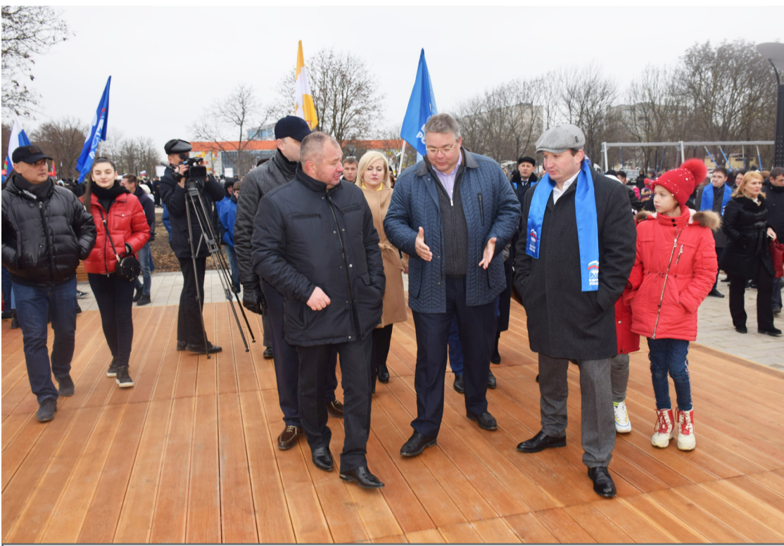
В день открытия Парка Дружбы. Город Георгиевск, 24 ноября 2018г.

И с точки зрения населения я задал бы вопрос: не откуда у нас деньги, потому