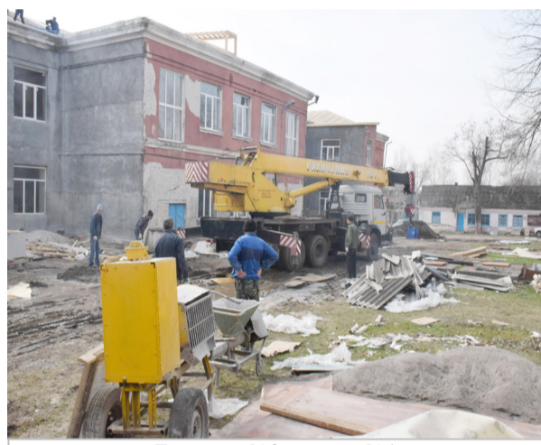
Гимназия №2 и школа №1 в стадии капитального ремонта.

я со своей стороны – как могу, они со своей стороны – как могут. Но есть баланс, есть общность целей и задач, понимание пути, поэтому мы несем этот хрупкий сосуд, и он не падает.