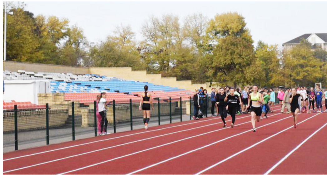
Стадион «Торпедо», новая легкоатлетическая дорожка.

И если программы строительства заводов – нет, то программа благоустройства, формирование комфортной среды или дорожный фонд – есть. Значит, нужно готовить проектный документ. Без выполнения строго определенных действий получить деньги невозможно.