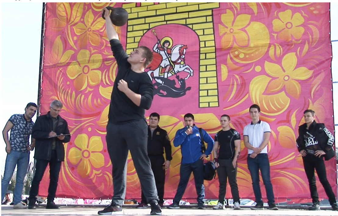
Силой мерялись богатыри георгиевские.