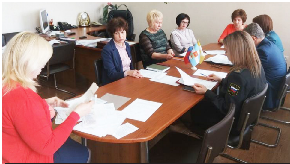
Идет рабочее совещание.

городского округа является концентрация денежных средств и возможность расширения участия в различных государственных программах регионального уровня.