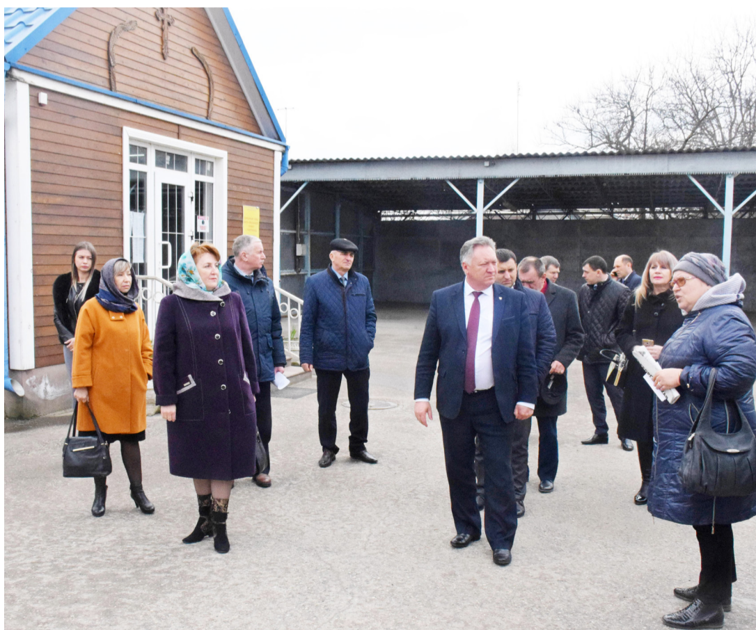
Материал подготовлен Управлением информационной и аналитической работы администрации Георгиевского городского округа

Также мы сегодня видели вашу замечательную водолечебницу, посмотрели, как обустроены места отдыха, тротуарные пешеходные дорожки, детские игровые площадки для воркаута, бульвар... Город живет и развивается! Я, как руководитель, обратила внимание на санитарное состояние Георгиевска и вижу, что город чистят, убирают, смотрят за ним. Это очень здорово!