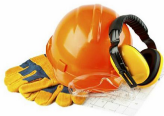
Финансирование предупредительных мер по сокращению производственного травматизма и профессиональных заболеваний

Управление труда и социальной защиты населения администрации Георгиевского городского округа напоминает работодателям Георгиевского округа о возможности снижения расходов на реализацию предупредительных мер по сокращению производственного травматизма и профессиональных заболеваний за счет средств обязательного социального страхования.