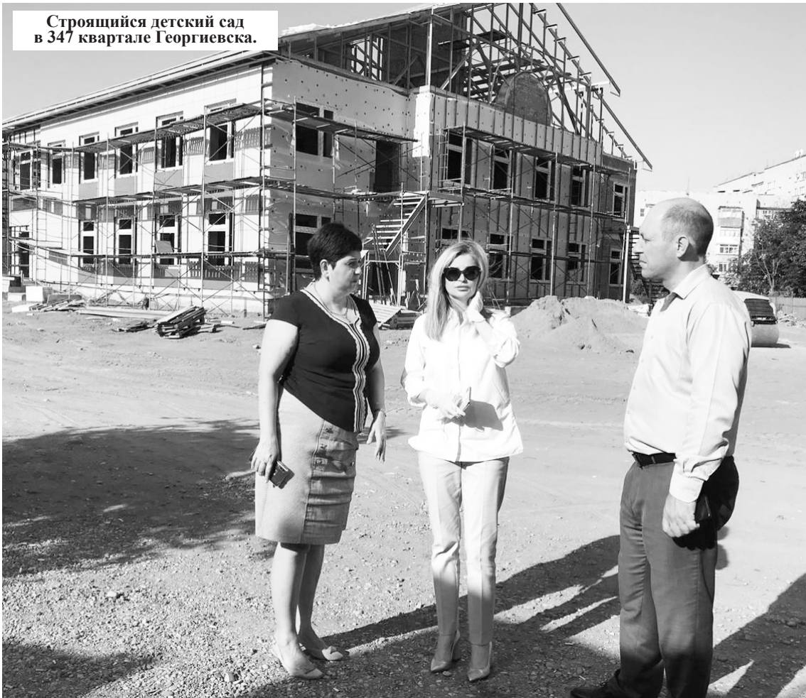
Строящийся детский сад в 347 квартале Георгиевска.