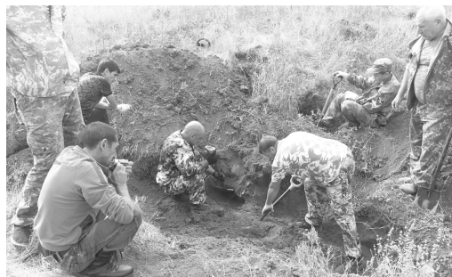
Поиск продолжается, и находятся без вести пропавшие герои, заслужившие того, чтобы их помнили.