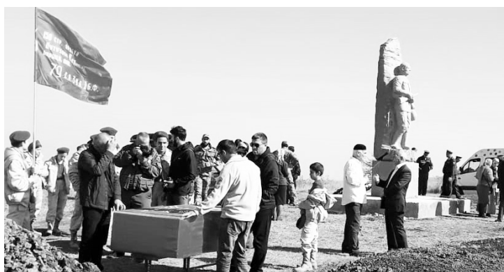
19 октября состоялось закрытие Вахты Памяти под городом Малгобеком, где в годы Великой Отечественной гремели бои. Здесь с почестями захоронили останки 11 солдат, в поисках которых участвовал и отряд «Георгиевская крепость».