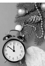
График работы магазинов в праздничные дни

Уважаемые жители и гости Георгиевского городского округа! В связи с новогодними и рождественскими праздниками рынки, ярмарки и дежурные магазины округа будут осуществлять работу в соответствии с установленным графиком.