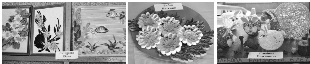
Фрагменты выставки декоративно-прикладного творчества.

направлениях, представленные на выставке; сильные вокальные номера в концертной программе.