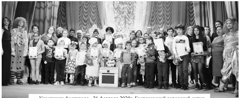
Участники фестиваля. 26 февраля 2020г. Георгиевский городской округ.

В XXIV фестивале художественного творчества детей с ограниченными возможностями здоровья в Георгиевском округе приняли участие около ста детей. Этот праздник организовали для них и провели УТСЗН администрации ГГО, Георгиевская организация ВОИ и городской Дом культуры.