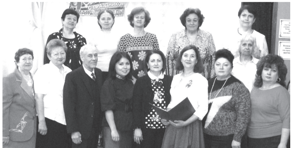
на фото: коллектив детской музыкальной школы

Закончился очередной учебный год. И очень хочется познакомить читателей с творческими успехами и педагогическими достижениями коллектива детской музыкальной школы.