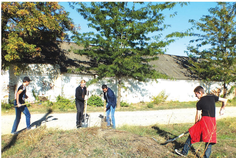
на фото: воспитанники центра «Аист» провели субботник

Идею сделать город чище и благоустроеннее уже поддержали многие городские общественные и образовательные организации.