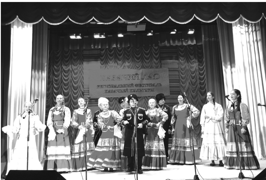
на фото: участники фестиваля «Казачий лад»

Георгиевск в четвертый раз принял участников регионального фестиваля-конкурса казачьей культуры «Казачий лад».