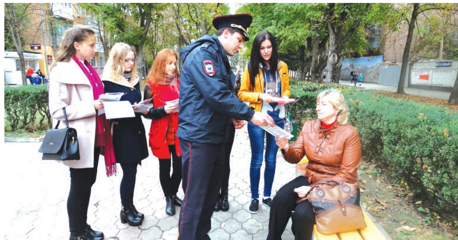
на фото: волонтеры «ЦМП» и сотрудник полиции вручили горожанам памятки