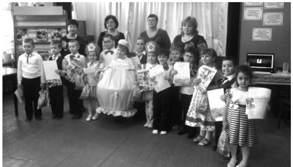
на фото: воспитанники детского сада №13 «Теремок»