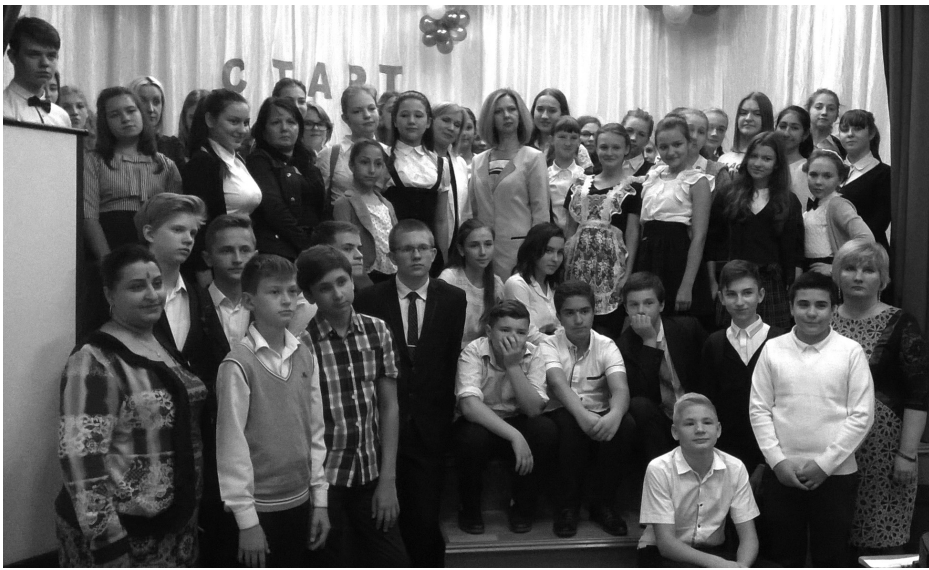
на фото: участники сбора-старта

На базе георгиевского Дома детского творчества состоялся сбор-старт детских общественных объединений образовательных учреждений города Георгиевска.