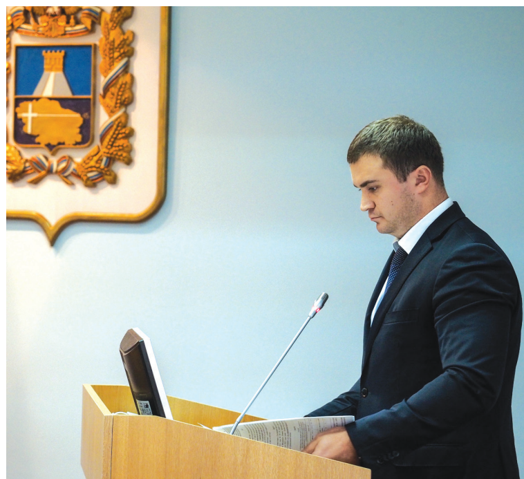
на фото: министр Виталий Хоценко