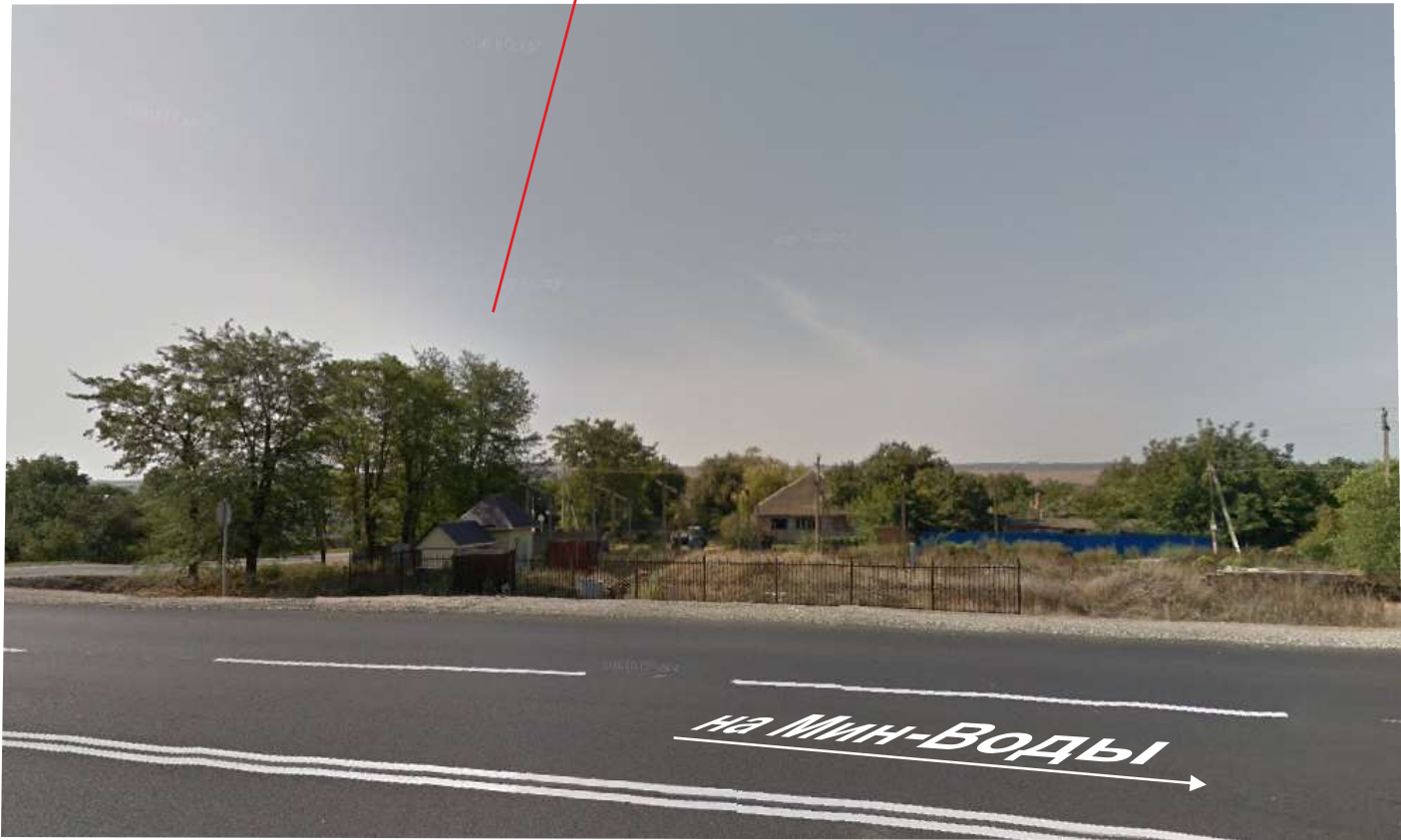
Земельный участок с к.н. 26:25:061302:263