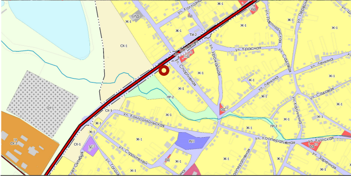
СХЕМА РАЗМЕЩЕНИЯ ОБЪЕКТА НА ЗЕМЕЛЬНОМ УЧАСТКЕ М 1:1000