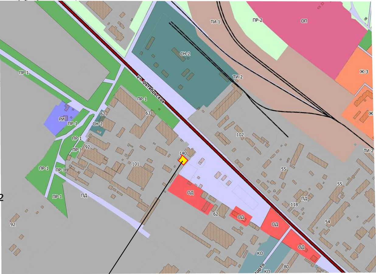
Зем/уч с к.н. 26:26:010202:425 расположен в зоне “ПД” - зоне производственной деятельности.