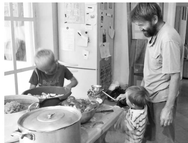
Делаем заготовки на зиму!