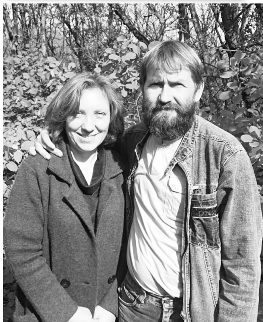
Когда гармония в душе.