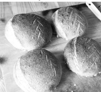
Нет ничего вкуснее маминого хлеба.