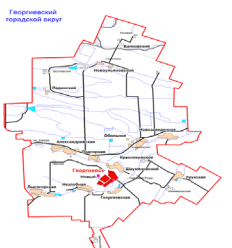
Рисунок 1 - географическое положение Георгиевского городского округа Ставропольского края

Георгиевский городской округ расположен в юго-западной части России на юге Ставропольского края и территориально принадлежит эколого-курортному региону федерального значения - Кавказские Минеральные Воды.