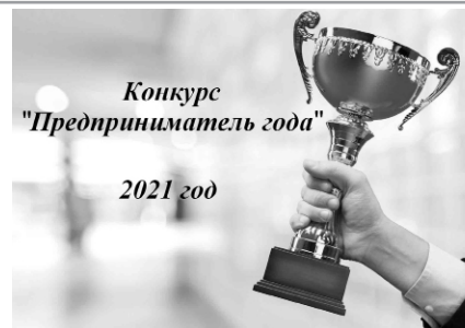
Конкурс «Предприниматель года» 2021 год

Победителями ежегодного конкурса «Предприниматель года» в Георгиевском городском округе по итогам 2021 года признаны следующие субъекты предпринимательства: