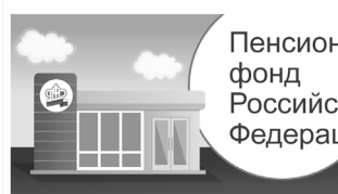
Пенсионный фонд Российской Федерации