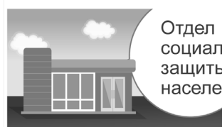
Отдел социальной защиты населения