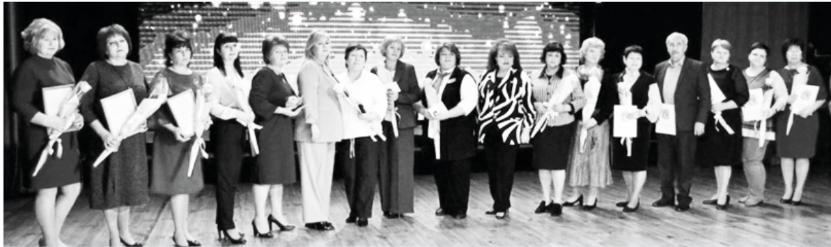
21 декабря в городском Дворце культуры прошло торжественное мероприятие, посвященное закрытию Года педагога и наставника.