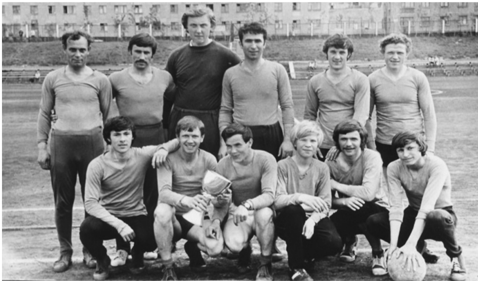
Фото комсомольской юности, г. Заполярный.