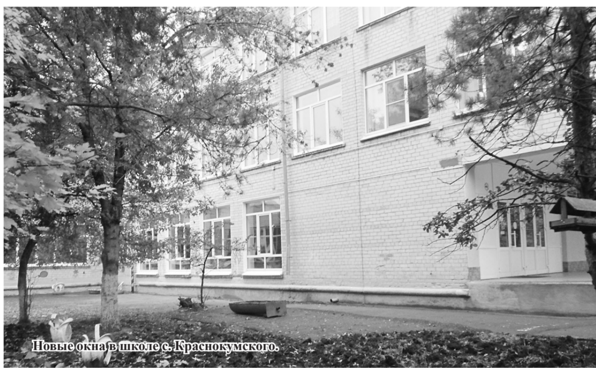
Новые окна в школе с. Краснокумского.

В последние годы заметно преобразился внешний вид наших школ и детских садов благодаря замене окон, главное - в них стало теплее. Этот масштабный проект реализуется на уровне края. В этом году работы по замене оконных блоков проведены в 234 образовательных организациях Ставрополья, а какие перемены в нашем округе?