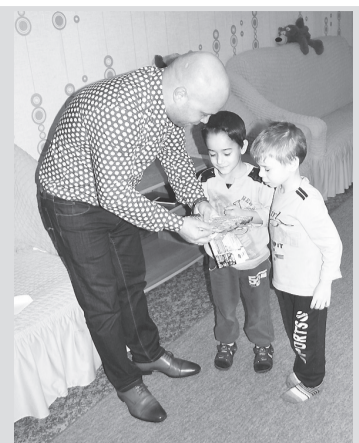
◆ Добрые дела