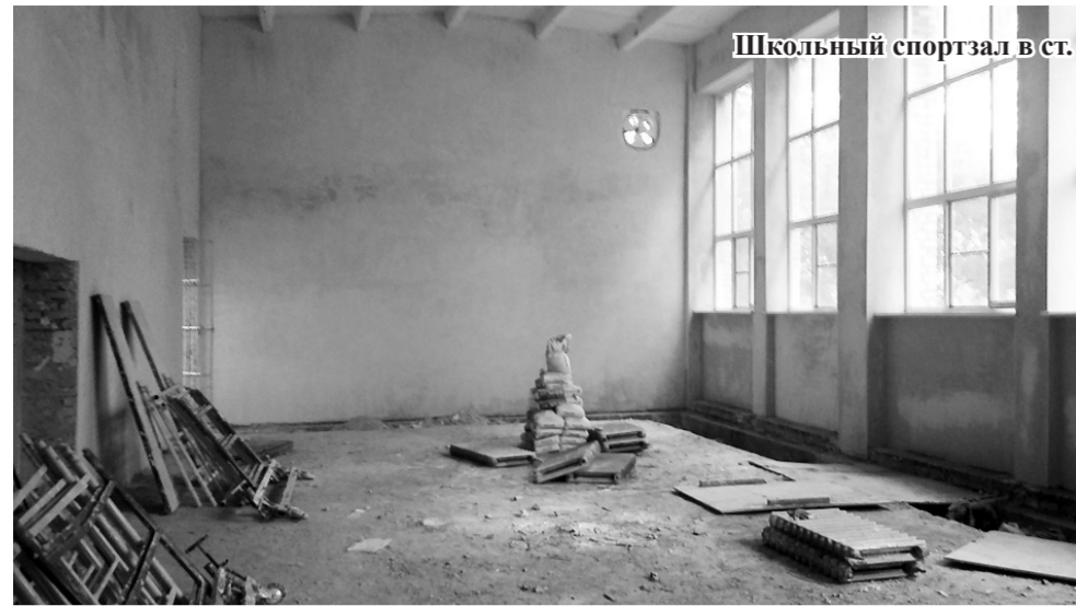
Школьный спортзал в ст. Георгиевской до и после ремонта.