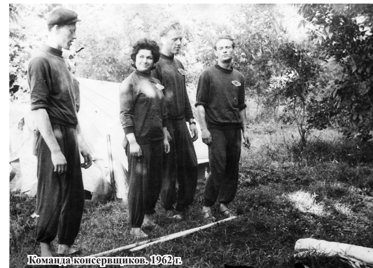
Команда консервщиков, 1962 г.