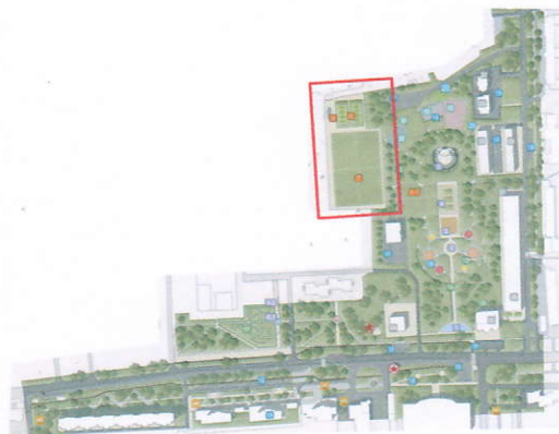
Схема проектного решения